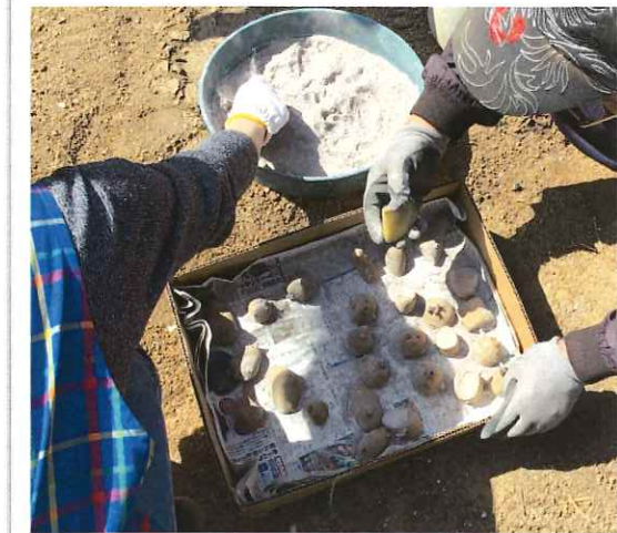
じゃがいもの切り口に 灰をまぶしています

さて・・・先日、保育園の畑では、じゃがいもを子どもたちが植えました。「じゃがいもって、こうやって植えるんだ!」「あっ!もうめがでてるよ!」「はやくはっぱがはえてこないかな?」「じゃがいもほりがたのしみだね!」みんなわくわくしながら、じゃがいもを植えました。収穫が、今からたのしみです!!